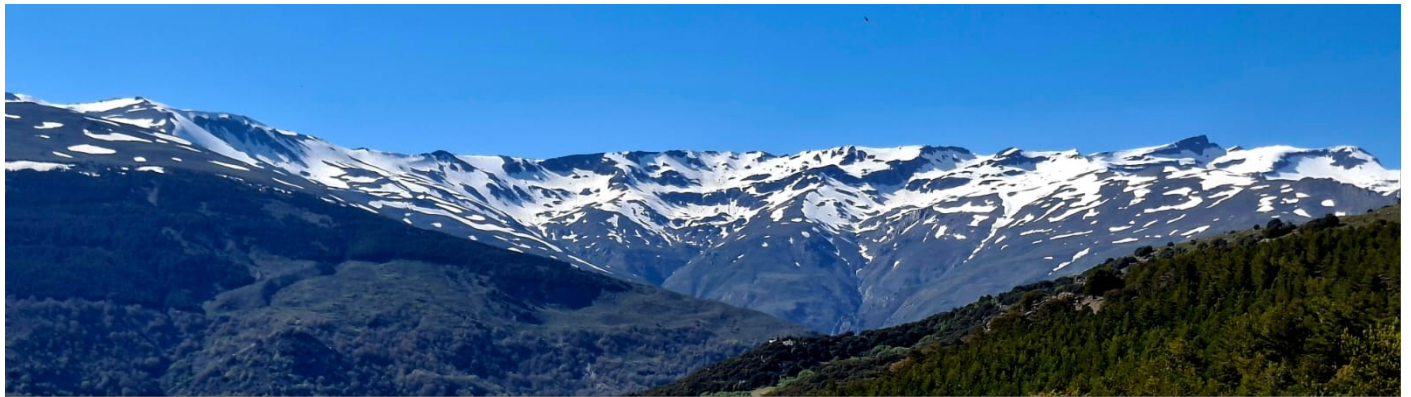
Cara sur del Tajo de Los Machos al Veleta 20-5-26