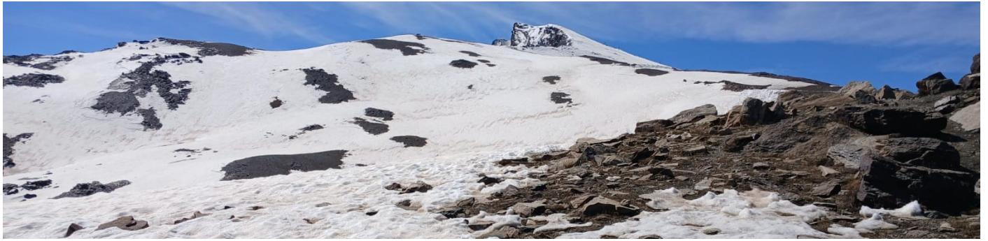
Zona Veleta, vertiente norte 20-5-26